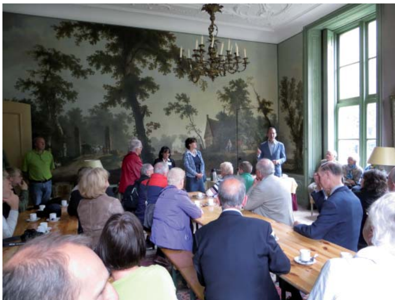
Loenersloot, Loenersloot (Utrecht).

In Ede is een stichting opgericht om de uitgave van een boekwerk over de buitenplaats Kernhem mogelijk te maken. De stichting houdt zich bezig met de fondsenwerving, de NKS coördineert het onderzoek en is verantwoordelijk voor de redactie.