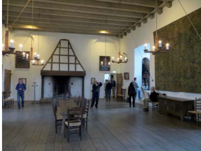
Ammersoyen, Ammerzoden (Gelderland).