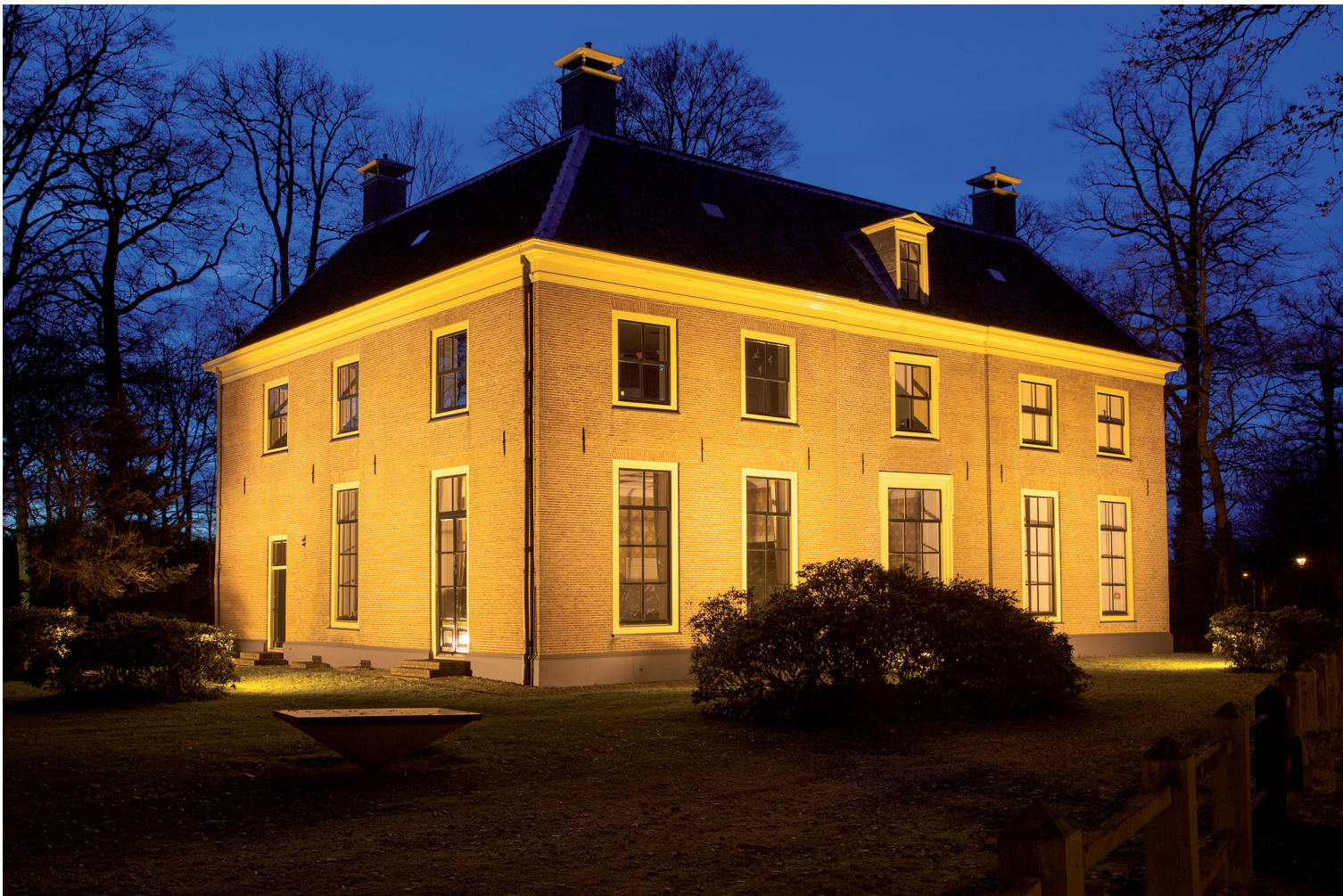
HET HUIS KERNHEM BIJ NACHT.