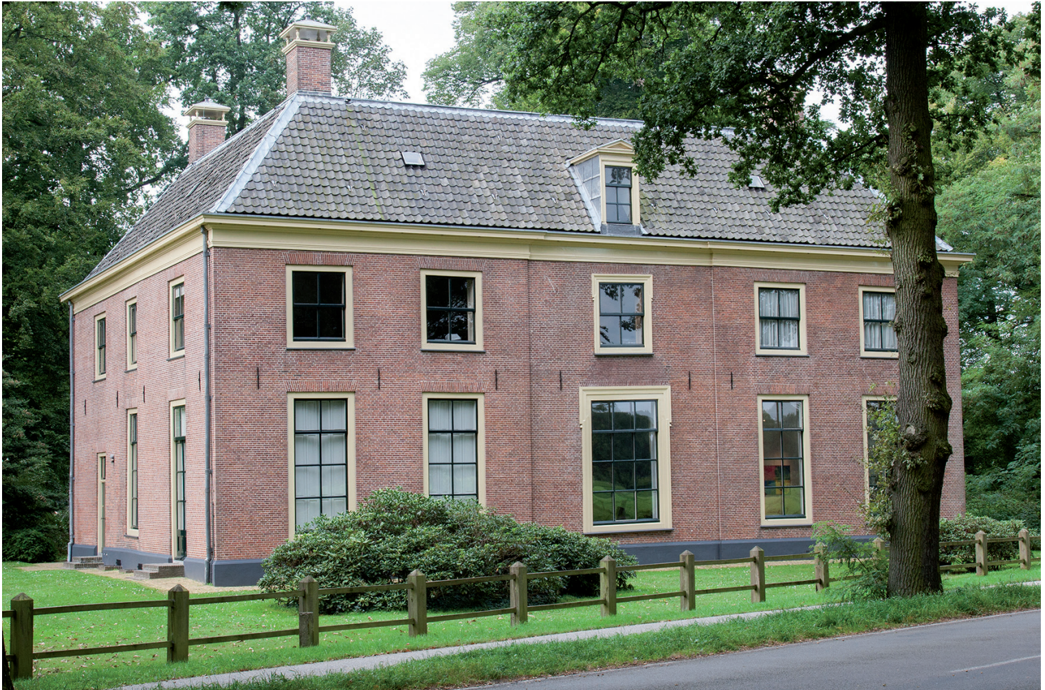
ACHTERZIJD VAN HET HUIS KERNHEM.

de fundamenten van het oude Kernhem werd een rechthoekig pand gebouwd, met een lange gang in het midden en aan beide zijden grote kamers, die uitkeken op het park. De slotgrachten gingen dicht en ook de tuin werd flink onder handen genomen. Lange lanen leidden naar een doolhof en het Edese Bos.