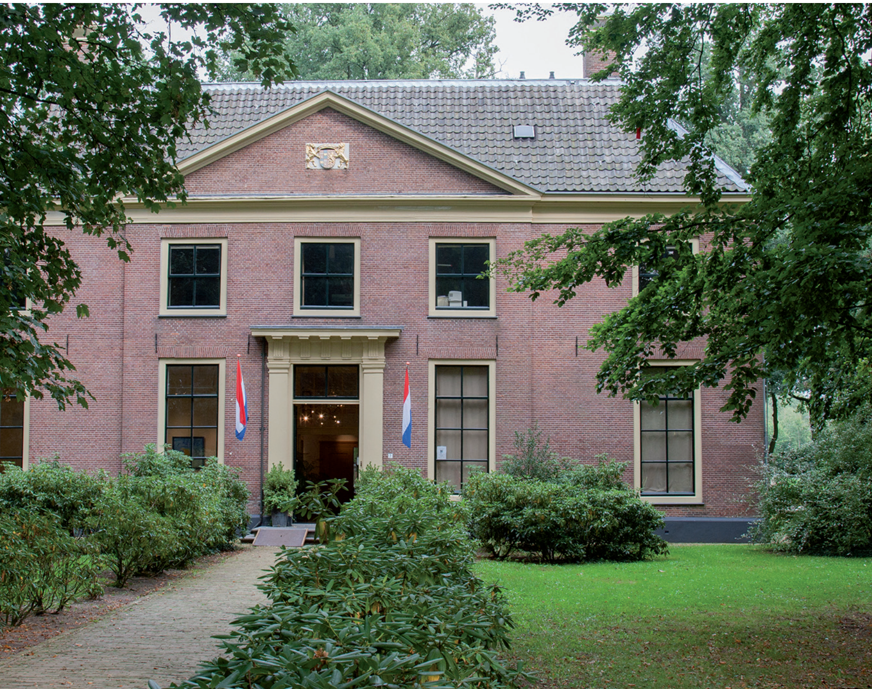
VOORAANZICHT VAN HET HUIS KERNHEM IN EDE.

Ergens rond 1400 moet ten noorden van Ede, op de overgang van de Veluwe naar het veengebied van de Gelderse vallei, een kasteelachtig huis zijn gebouwd. Het deed lange tijd dienst als jachtslot en later als buitenplaats voor rijke eigenaren, die meestal elders woonden en het huis verhuurden.