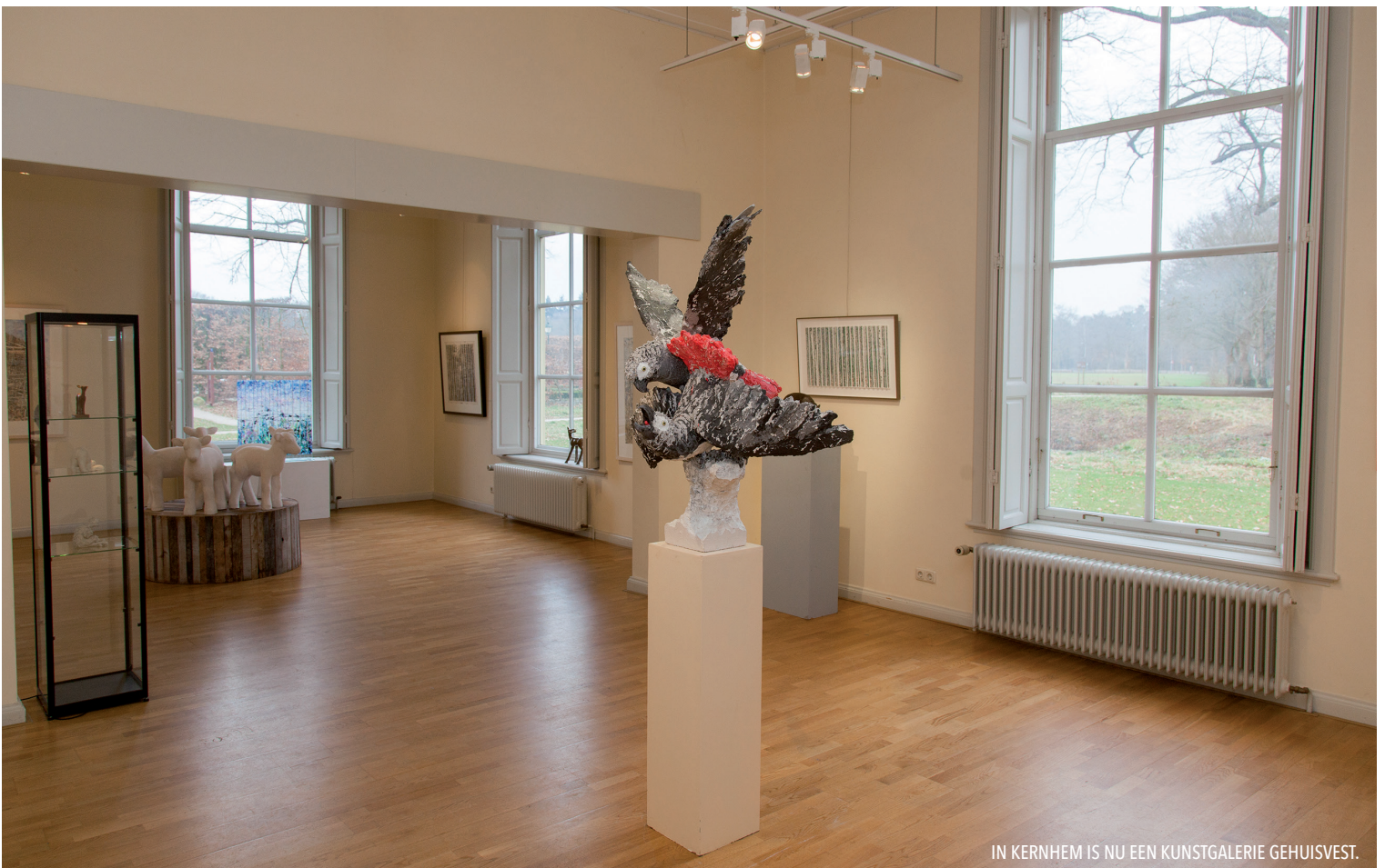
IN KERHEM IS NU EEN KUNSTGALERIE GEHUISVEST.