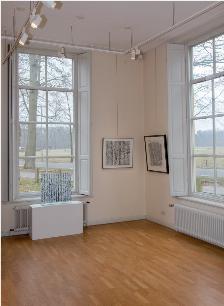
DE BENEDENVERDIEPING WORDT O.A. GEBRUIKT VOOR CULTURELE MANIFESTATIES.