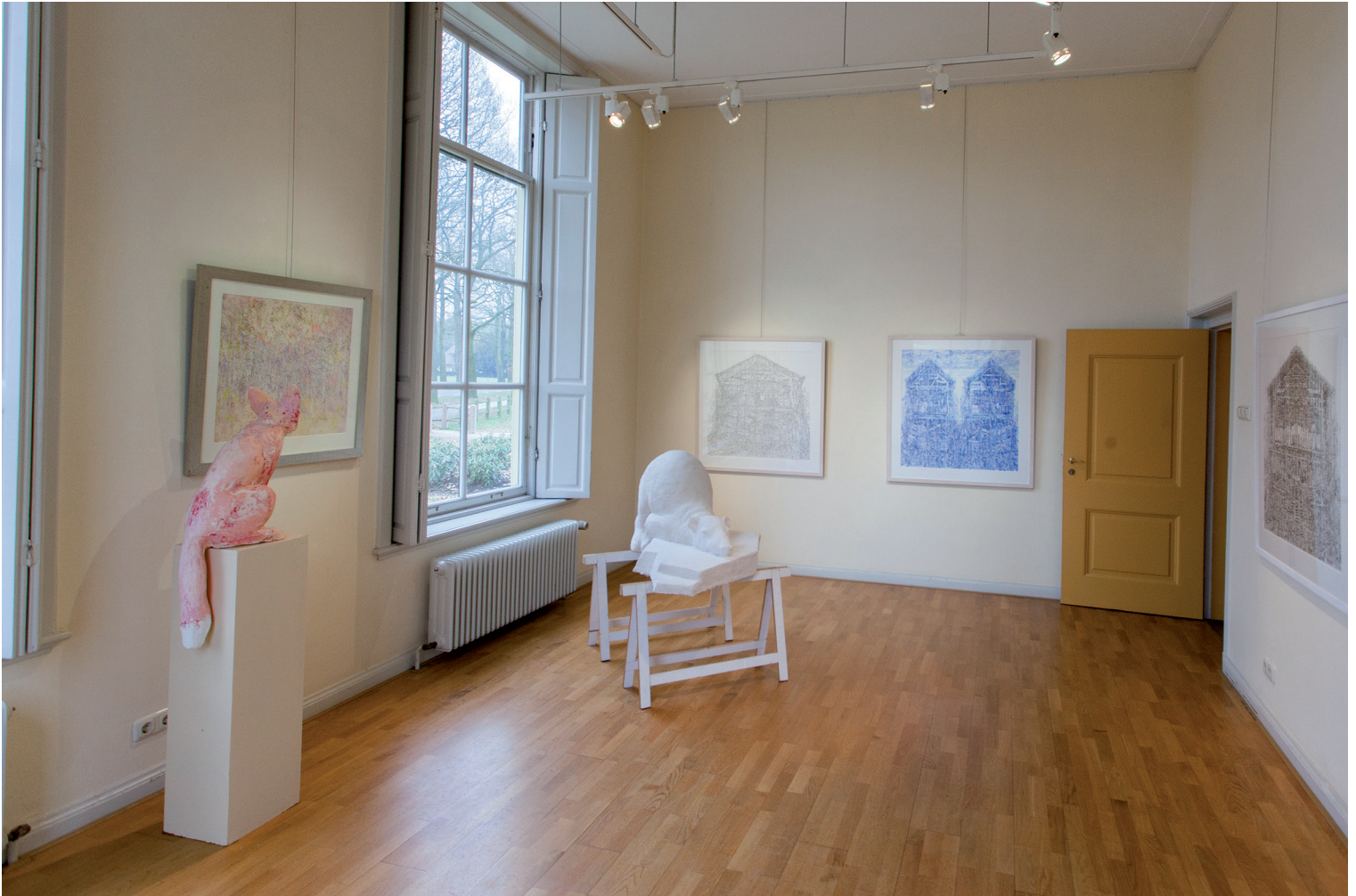
INTERIEUROPNAME VAN HET HUIDIGE HUIS.